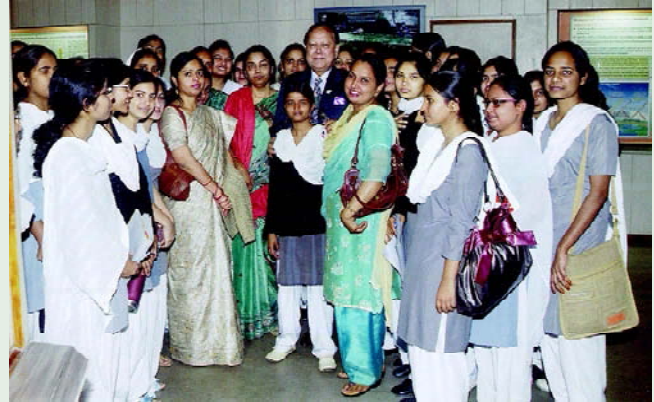
राष्ट्रीय विज्ञान दिवस के आयोजन के लिए 28 फरवरी 2011 को राष्ट्रीय वनस्पति अनुसंधान संस्थान, लखनऊ में आयोजित कार्यक्रम का शुभारंभ हुआ।